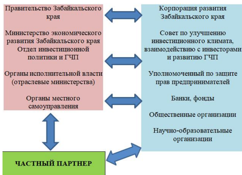
Рис. 2. Взаимодействие участников ГЧП / Fig. 2. Interaction between PPP participants

6) соглашения о сотрудничестве и взаимодействии в сфере социально-экономического развития Забайкальского края.